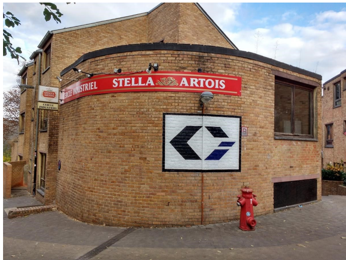
L'objet de tous les désirs : Le Cercle Industriel

Mais si tu es déjà décidé et que ta route est toute tracée vers l'élite de la guindaille, c'est rdv à 18h30 place des paniers en face du CI pour le début des hostilités.