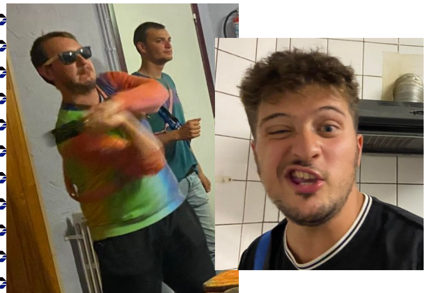
Voici quelques images...