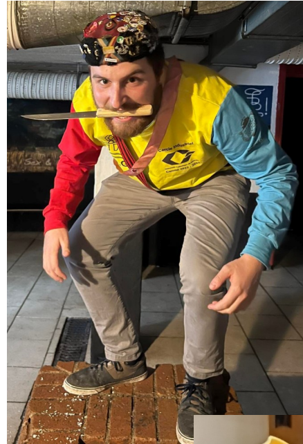
Les ravages de l'alcool, pauvre Rambo...

Pour faire rentrer cette image j'ai dû la rogner... C'est poétique en un sens.